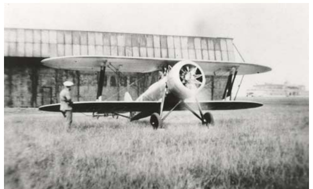
Essai moteur du R-34, cette fois avec le capot NACA bien en place autour du moteur Renard 200. (Musée Royal de l'Armée)