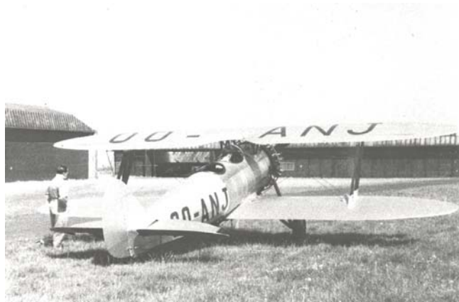
Le R-34 avec le capot NACA enlevé, probablement pour inspection du moteur le 16.10.1933 à Haren, le jour du concours militaire.