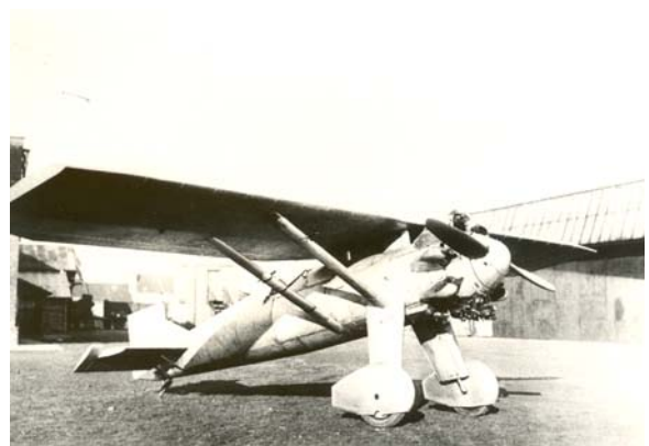
Fraîchement sorti de chez SABCA, le deuxième Renard Epervier est vu ici avec les capotages profilés de roues. (MRA)