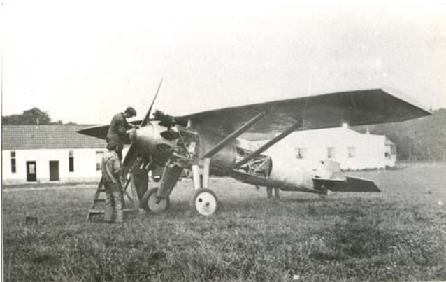
La dernière main est mise à l'Epervier construit par Stampe & Vertongen avant ses essais et son crash fatal d'octobre 1928.