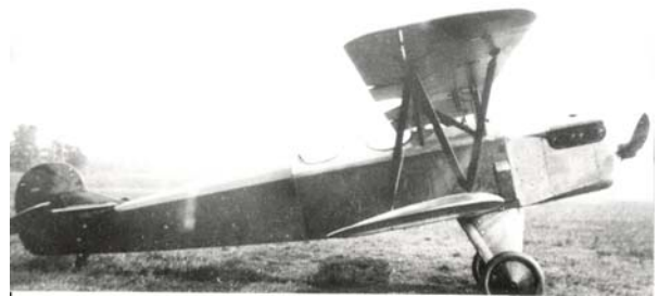
L'une des rares photos de l'unique RSV 23-180, probablement à Deurne en 1927.