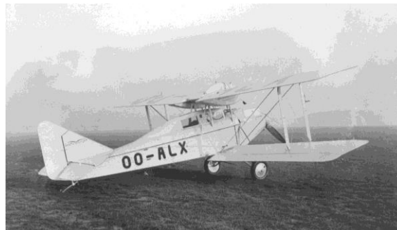
Fin 1931, le RB 30 spécial OO-ALX gréé de réservoirs supplémentaires au plan supérieur en vue du raid Bruxelles-Léopoldville qui tourna court en février 1932.