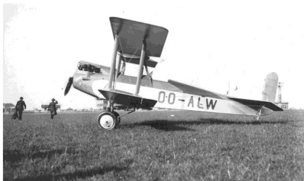
Tout rutilant, le RB 30 Sport immatriculé OO-ALW sorti des ateliers, en mai 1931; il vola aux mains de 3 propriétaires et disparut durant la guerre.