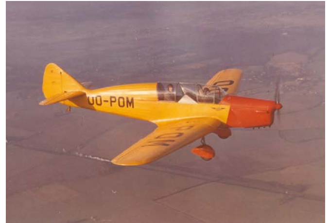
Le Tipsy M en vol depuis White Waltham début 1948.

Finalement, sur une série prévue de 10 appareils, seuls deux Fairey Primer furent effectivement construits, dont le premier était en fait le Tipsy M