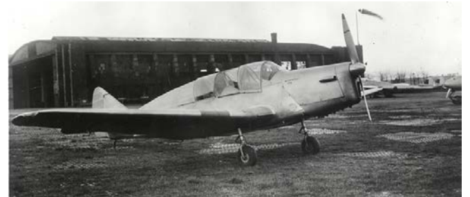
Le deuxième Fairey Primer (Tipsy M) immatriculé G-ALEW (n/c F.8456) gréé d'un moteur Blackburn Cirrus Major 3 sur un aérodrome anglais en décembre 1948.