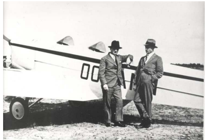
Constructeur et concepteur posent devant le Saint-Hilbert, 135 B. O. (Baudoux-Orta), probablement début 1935.

Sorti des ateliers fin 1934, l'appareil effectua son premier vol début 1935 aux mains du pilote Georges Debroux qui était moniteur à Liège-Bierset. Dès ce vol inaugural, cet appareil à la belle aérodynamique tint ses promesses.