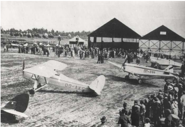
Rallye au château d'Ardenne au milieu des années 30; le Saint-Hubert 135 B. O. est immatriculé 00-ANN et se trouve à droite de l'SV 18M 00-AKG.

Deux B.O. seulement furent construits. Le 135 B.O. gréé d'un moteur Cirrus Hermes de 135 HP qui fut immatriculé 00-ANN le 31.01.1935 avec le certificat de navigabilité no 300 de l'Administration de l'Aéronautique Belge; cet appareil est présumé avoir disparu durant la dernière guerre et ne fut radié qu'en 1946. Le second, le 80 B.O., était propulsé par un moteur de 80 HP; il fut immatriculé 00-ASZ le 23.07.1937 et radié début 1946.